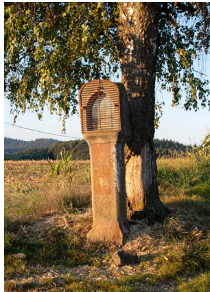
Bildstöckchen „Kalter Herrgott“ in Weinheim